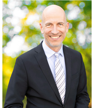
Bundesminister Univ.-Prof. Dr. Martin Kocher

Ich darf Sie herzlich dazu einladen, Ihre erfolgreichen Marketingleistungen einzureichen und freue mich bereits jetzt auf einen spannenden und innovationsreichen Wettbewerb um den Staatspreis Marketing 2024.